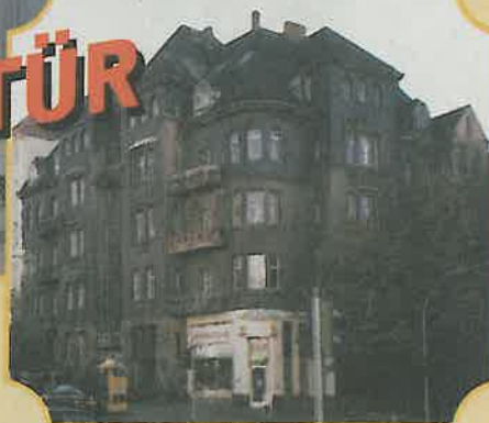
Das Wohnhaus vor der Sanierung.

J. Lönnecker Diplomingenieure Hochbau + Tragwerksplanung Wilhelm-G. Spangenberg-Str. 12 · 98529 Suhl Tel. 0 36 81 / 39 02 - 0 · Fax 0 36 81 / 39 02 - 99