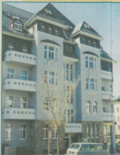
Eckhaus Ulmenstraße/Weststraße mit Konditorei Efreuna