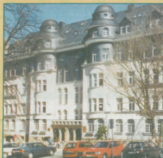
Hoffmannstraße 58 - 60

Im Ergebnis erhalten die fertiggestellten Häuser das Prädikat „TÜV - geprüfte Bauqualität“. Die von hohem Wohnwert geprägten Gebäude liegen zudem in einem recht grünen Viertel, verfügen zumeist über sehr ruhige, großzügige Innenhöfe und bieten somit Wohnkultur pur. Modernes Bauen an historischen Gebäuden, Passion und Verantwortung, der sich die Firma Stender & Partner ganz verschrieben hat.