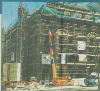
Eckhaus Georg-Landgraf-Straße 36