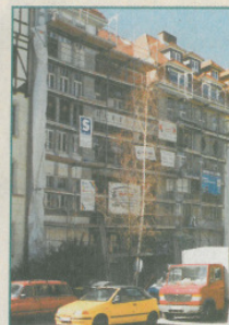
Sanierungsarbeiten an der Ulmenstraße 57

Am Gelingen der Bauarbeiten beteiligte Firmen empfehlen sich für weitere anspruchsvolle Aufgaben