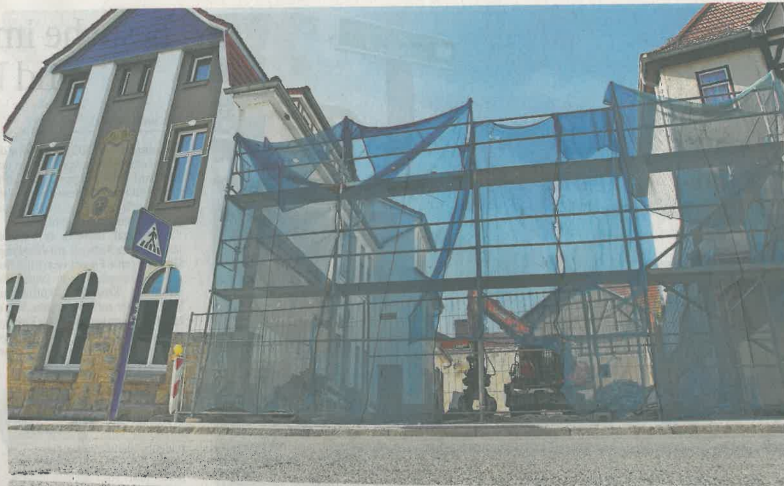
Das Tagescafé zwischen „Stadt Wien“ und Blumengeschäft am Mehliher Markt ist abgerissen. Die Städtische Wohnungsbaugesellschaft will im Herbst mit dem Umbau des ehemaligen Hotels zu einem Wohnhaus beginnen und in dem Zuge auch einen Innenhof gestalten.

lis – Ein 14-Jähriger aus ete erst am Donnerstag- g bei der Polizei eine t. Wie Sprecher Fred Jäte, befuhr der Junge mit rrad bereits am Diens-45 Uhr die Bahnhofstraße-Mehlis in Richtung . Kurz vor der Einmün- inigte Äcker" fuhr ein es Auto so dicht an ihm ss der 14-Jährige vor en Lenker nach rechts ber die Bordsteinkante ehweg stürzte. Hierbei 1 Verletzungen an Arm der rechten Körperseite