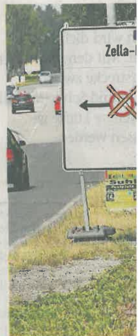
Die Industriestraße ist ab Montag voll gesperrt.

Zella-Mehlis – Eine Vollsperrung in der kommenden Woche in der Industriestraße erforderlich. Ab Montag, 25. Juli, im Bereich von der Kreuzung Sühler Straße bis zur Einmündung der Wäscherei dicht gemacht. Gefährdung für die Oberflächensanierung der Fahrbahn, teilte Stadtsprecher Volker Voigt am Freitag mit.