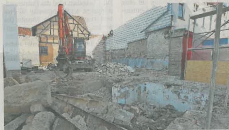
Die rund 450 Quadratmeter große Fläche wird beräumt und soll künftig als Innenhof mit viel Grün gestaltet und zum Parken nutzbar sein.

Akten. Nach der Wende teilten es die Inhaber der beiden Gebäude. „Jetzt haben wir wieder eine Verschmelzung beantragt“, gibt der SWG-Chef über den aktuellen Stand der Dinge